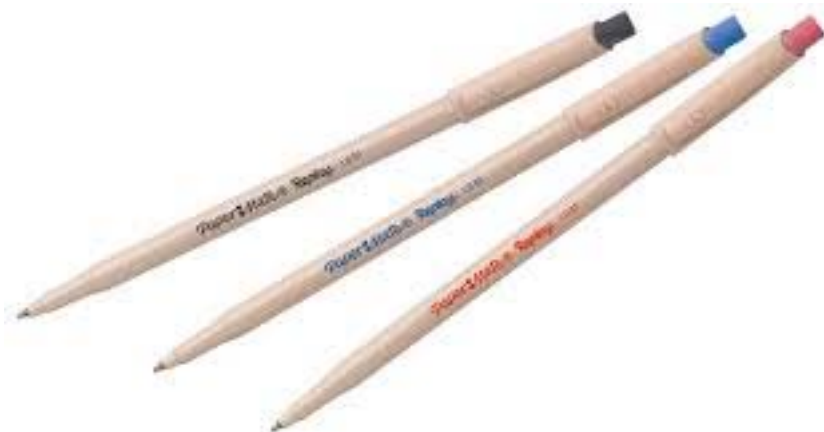
Penna cancellabile Replay