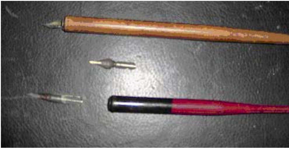
Penna con pennino