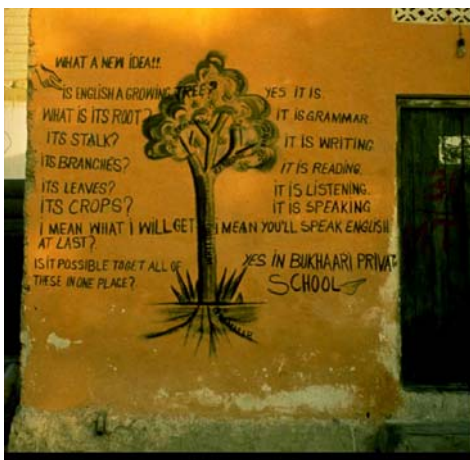
Scuola di corsi d'inglese Mogadiscio, Medina, Wadajir Iscrizione: “Che bella idea!! È l'inglese una crescita? Sì, lo è. Qual'è la sua radice? È la grammatica. Il suo tronco? È scrivere. I suoi rami? Sono leggere. Le sue foglie? Sono ascoltare. I suoi frutti? Sono parlare. In sostanza, cosa ci guadagno?

Saprai parlare inglese. Dunque è possibile ottenere tutto questo frequentando un solo posto? Sì, frequentando la scuola privata Bukhari.”