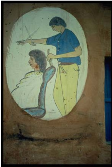
Barbiere, parrucchiere Bottega Mogadiscio Medina, Wadajir