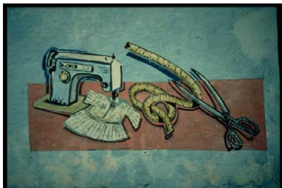
Abbigliamento Produzione e vendita Mogadiscio Kaatán, Villa Somalia