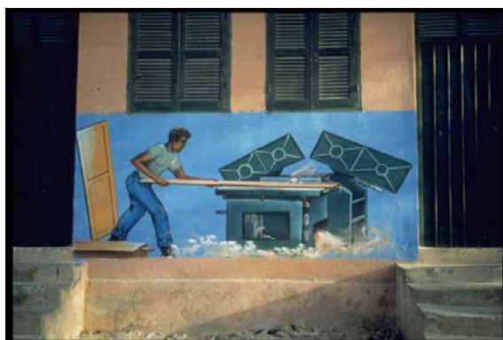
Falegnameria Produzione e vendita Mogadiscio Ummadda, via del Sinai